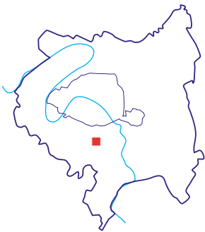
Site «Inventons la Métropole du Grand Paris», La Redoute des Hautes Bruyères