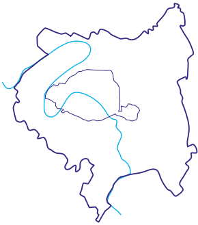
Site «Inventons la Métropole du Grand Paris», Carré Sénart

Allée de l'Histoire, allée de l'Avenir 77127 Sénart-Lieusaint