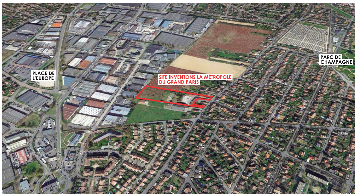
Site «Inventons la Métropole du Grand Paris», Site de l'Armée Leclerc

Avenue de l'Armée Leclerc 91420 Morangis